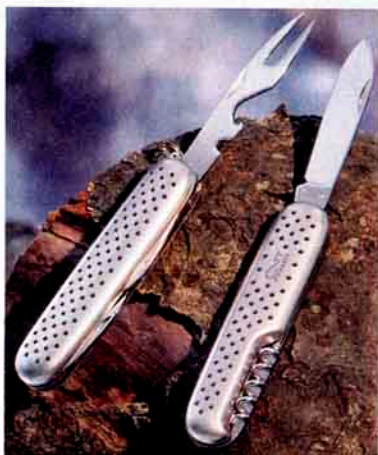
3 Taschenmesser, reif fürs Museum