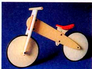
2 Lauflernrad aus heller Birke