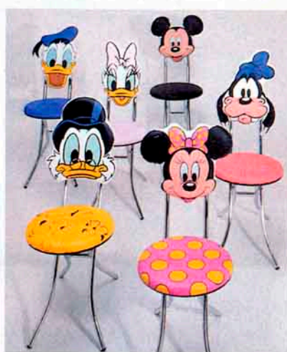
4 Disney-Stars als Platzanweiser