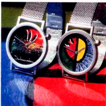
6 Zeitgeist: Kunst am Arm