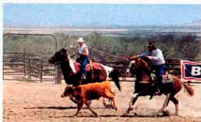
5 Gesucht: Cowboys mit Diplom