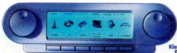
1 Klangvolles Design

Prisma-Tips zum Fest: bessere Ideen hat auch das Christkind nicht